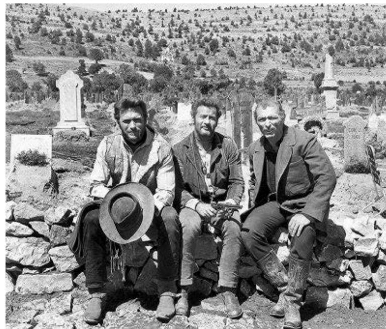
Arriba, los ideólogos del documental; abajo, Eastwood, Wallach y Van Cleef.