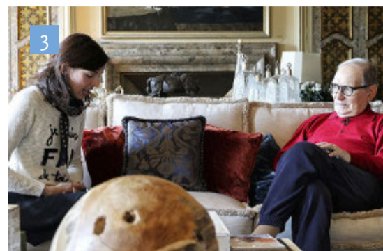
1 • James Hetfield, líder de la banda Metallica, durante el rodaje para el documental. 2 • El gran, único, irrepitible Clint Eastwood es otro de los grandes atractivos de esta película. 3 • Otro genio, Ennio Morricone, autor de la banda sonora El bueno, el feo y el malo .