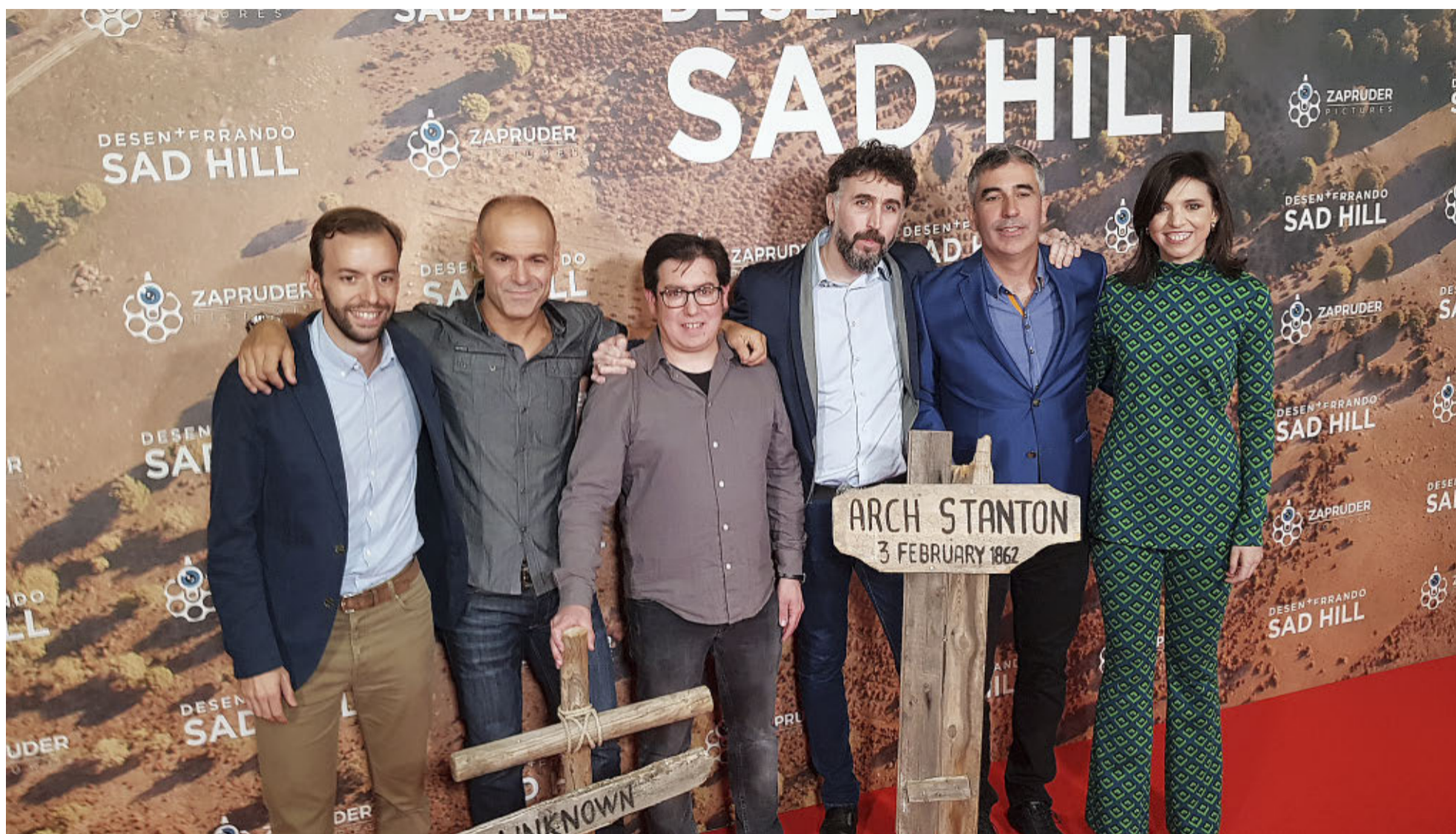
El director y algunos de los impulsores y protagonistas del documental, el jueves durante el preestreno de la cinta en el cine Capitol de la Gran Vía de Madrid. / AQUILINO MOLINERO