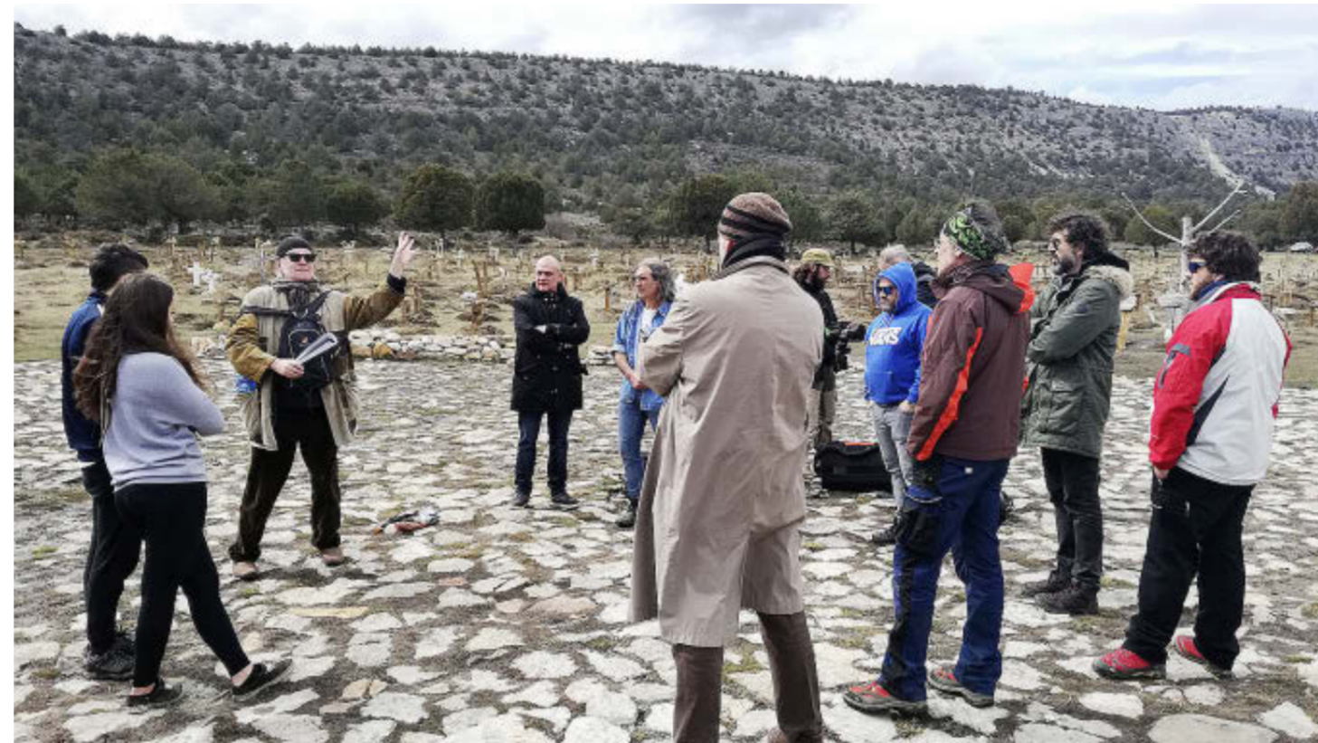
El cineasta, con actores y miembros de la Asociación Cultural Sad Hill.