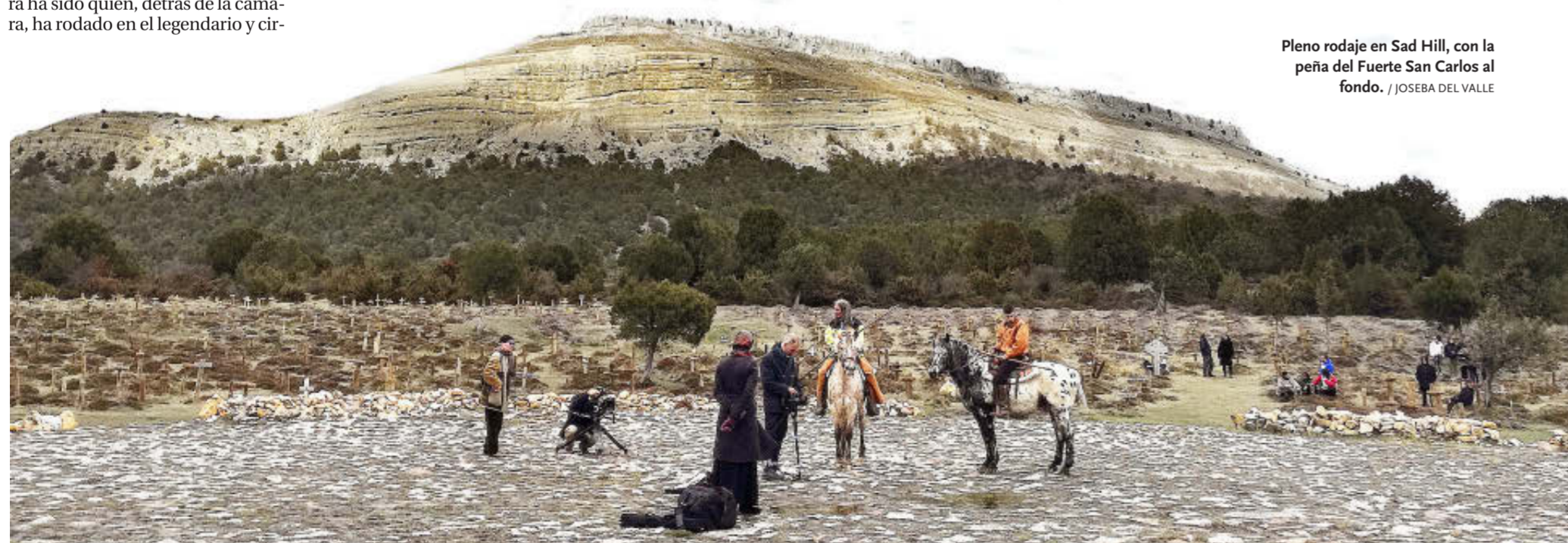
Pleno rodaje en Sad Hill, con la Peña del Fuerte San Carlos al fondo.

Andrey Tarkovsky, Michelangelo Antonioni, Víctor Erice o Sergio Leone. Satisfecho con el rodaje y con la acogida y ayuda de la Asociación Sad Hill, el cineasta alaba el gran potencial de Burgos y Castilla y León como plató de cine.