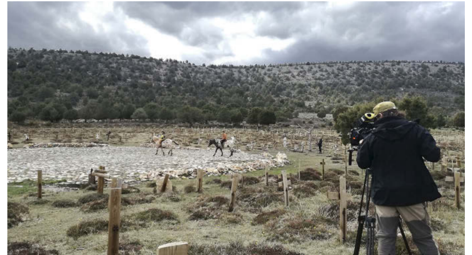
El imponente paraje y el magnetismo del cementerio ideado por Leone sedujo al cineasta finlandés. / JOSEBA DEL VALLE